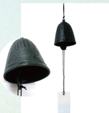
No. 303-296 ¥1,000 風鈴 約 大 サイズ/ 48.0x5.8 コード/ 332961 72/C 12/I/N