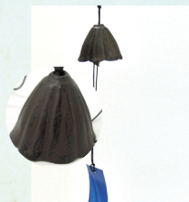
No. 303-295 ¥600 風鈴 B サイズ/ 48.0x4.5 コード/ 332954 72/C 12/I/N