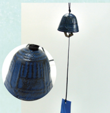
No. 303-293 ¥600 風鈴 A-2 サイズ/ 48.0x4.5 コード/ 332930 72/C 12/I/N