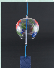
No. 509-022 ¥500 江戸風鈴 朝顔 サイズ/ 8.0x6.5 コード/ 590224 144/C 12/I/N