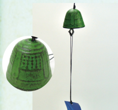
No. 303-294 ¥600 風鈴 A-3 サイズ/ 48.0x4.5 コード/ 332947 72/C 12/I/N