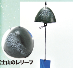
No. 303-291 ¥800 風鈴 富士 サイズ/ 50.0x6.5 コード/ 332916 72/C 12/I/N