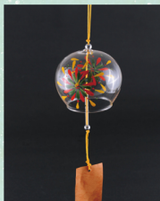
No. 509-021 ¥500 江戸風鈴 花火 サイズ/ 8.0x6.5 コード/ 590217 144/C 12/I/N