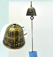
No. 303-292 ¥600 風鈴 A-1 サイズ/ 48.0x4.5 コード/ 332923 72/C 12/I/N