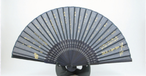
No. 504-701 ¥1,000 シルク扇子 長寿の心得 金/紺 サイズ / 22.5x3.2x0.8 コード / 547013 200/C 10/IN