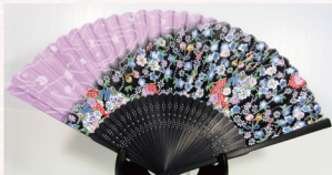
No. 504-741 ¥1,000 シルク扇子 梅と鈴 サイズ / 22.5x3.2x0.8 コード / 547419 200/C 10/IN