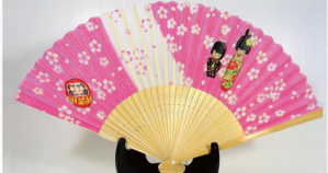
No. 504-746 ¥1,000 シルク扇子 桜とこけし サイズ / 22.5x3.2x0.8 コード / 547464 200/C 10/IN