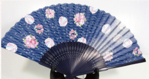
No. 504-742 ¥1,000 シルク扇子 花鶴 サイズ / 22.5x3.2x0.8 コード / 547426 200/C 10/IN