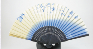
No. 504-577 ¥1,000 シルク扇子 桔梗 サイズ / 22.5x3.2x0.8 コード / 545774 200/C 10/IN