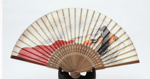
No. 504-726 ¥1,000 シルク扇子 十二単 サイズ / 22.5x3.2x0.8 コード / 547266 200/C 10/IN