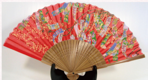
No. 504-743 ¥1,000 シルク扇子 短冊 サイズ / 22.5x3.2x0.8 コード / 547433 200/C 10/IN