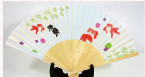
No. 504-744 ¥1,000 シルク扇子 金魚 プルー サイズ / 22.5x3.2x0.8 コード / 547440 200/C 10/IN