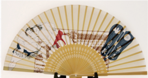
No. 504-557 ¥1,000 シルク扇子 相撲 サイズ / 22.5x3.2x0.8 コード / 545576 200/C 10/IN