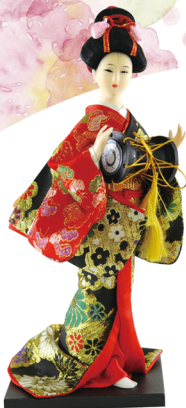
No. 303-020 ¥2,600 9インチ 日本人形 太鼓 サイズ/9インチ コード/ 303206 24/C