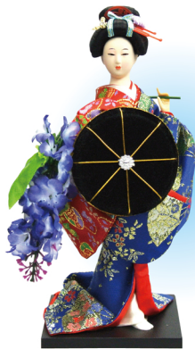
No. 303-026 ¥2,600 9インチ 日本人形 薔嬢 サイズ/9インチ コード/ 330264