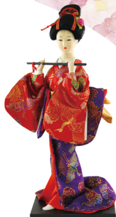
No. 303-023 ¥2,600 9インチ 日本人形 笛 サイズ/9インチ コード/ 303237 24/C