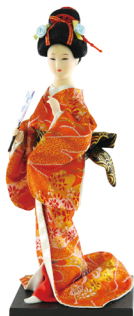
No. 303-024 ¥2,600 9インチ 日本人形 團扇 A サイズ/9インチ コード/ 303244 24/C