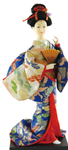
No. 303-022 ¥2,600 9インチ 日本人形 扇子 サイズ/9インチ コード/ 303220 24/C