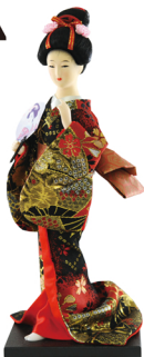
No. 303-025 ¥2,600 9インチ 日本人形 団扇 B サイズ/9インチ コード/ 303251 24/C