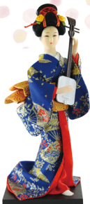
No. 303-021 ¥2,600 9インチ 日本人形 三味線 サイズ/9インチ コード/ 303213 24/C