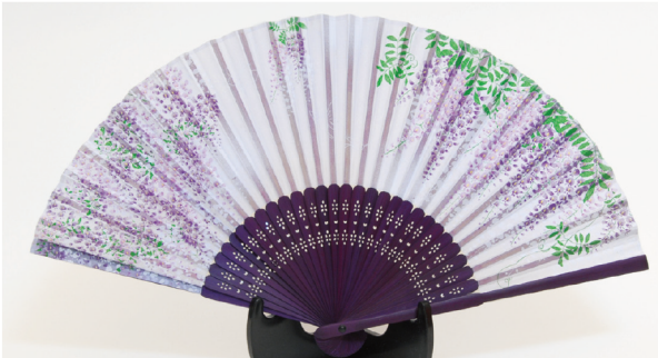
No. 504-550 シルク扇子 藤 (紫) サイズ / 22.5x3.2x0.8 コード / 545507 ¥1,200 200/C 10/IN