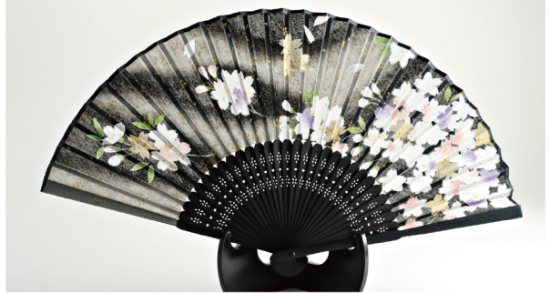
No. 504-547 シルク扇子 さくら黒 ラメ入 サイズ / 22.5x3.2x0.8 コード / 545477 ¥1,200 200/C 10/IN