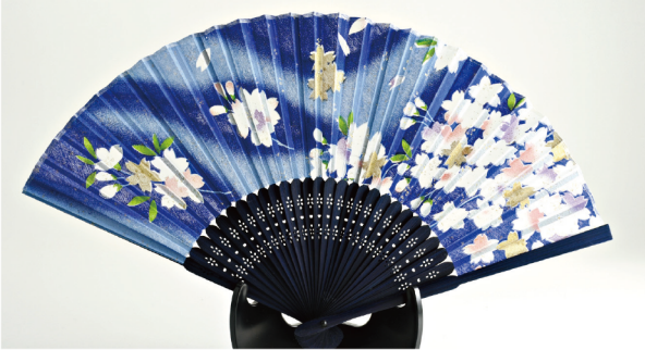
No. 504-546 シルク扇子 さくら青 ラメ入り サイズ / 22.5x3.2x0.8 コード / 545460 ¥1,200 200/C 10/IN