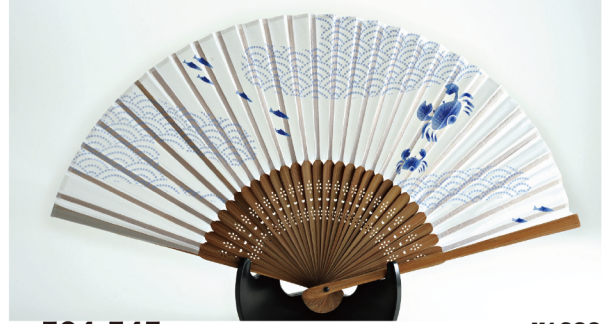
No. 504-545 シルク扇子 カニと青波 サイズ / 22.5x3.2x0.8 コード / 545453 ¥1,200 200/C 10/IN