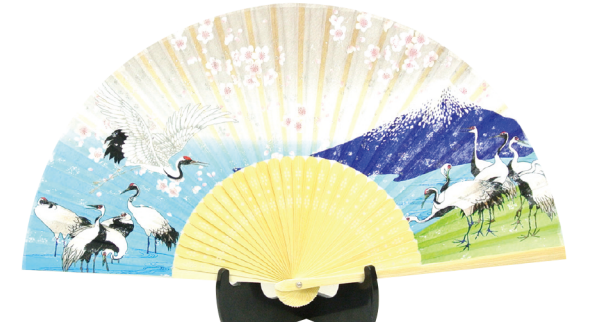
No. 504-334 シルク扇子 富士山と鶴 ラメ入り サイズ / 22.5x3.2x0.8 コード / 543343 ¥1,200 200/C 10/IN