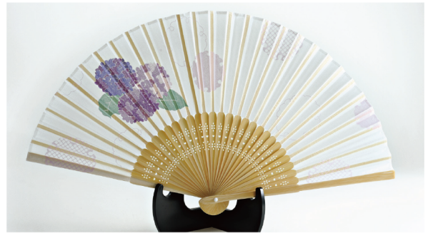
No. 504-543 シルク扇子 あじさい サイズ / 22.5x3.2x0.8 コード / 545439 ¥1,200 200/C 10/IN