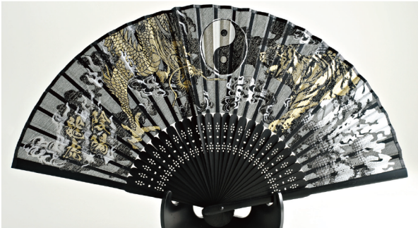
No. 504-548 シルク扇子 陰陽龍虎 サイズ / 22.5x3.2x0.8 コード / 545484 ¥1,200 200/C 10/IN