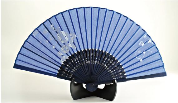
No. 504-542 シルク扇子 朝顔 ブルー サイズ / 22.5x3.2x0.8 コード / 545422 ¥1,200 200/C 10/IN