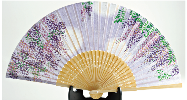
No. 504-551 シルク扇子 藤 サイズ / 22.5x3.2x0.8 コード / 545514 ¥1,200 200/C 10/IN