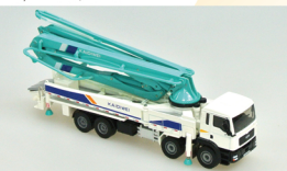
No. 208-918 ダイキャスト重機 コンクリートポンプ車 サイズ/28.5x26.0x7.5 コード/289180