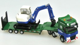
No. 208-914 ダイキャスト重機 低床貨物車&掘削機 サイズ/29.0x11.5x7.0 コード/289142