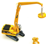
No. 208-910 ダイキャスト重機 マテリアルハンドラー サイズ/20.0x26.0x6.5 コード/289104