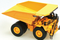
No. 208-917 ダイキャスト重機 ミニダンプトラック サイズ/24.0x21.0x15.0 コード/289173