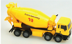
No. 208-916 ダイキャスト重機 ミキサー車 サイズ/23.0x11.5x6.0 コード/289166