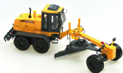
No. 208-912 ダイキャスト重機 モーターグレーダー サイズ/33.0x17.0x12.0 コード/289128