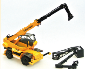
No. 208-913 ダイキャスト重機 資材輸送機 サイズ/30.0x21.0x10.0 コード/289135