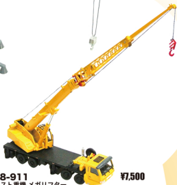
No. 208-911 ダイキャスト重機 メガリフター サイズ/25.5x26.0x7.5 コード/289111