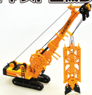
No. 208-908 ダイキャスト重機 溝掘機 サイズ/30.0x35.0x10.0 コード/289081