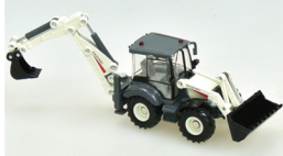
No. 208-915 ダイキャスト重機 バッグホーローダー サイズ/22.5x11.5x6.0 コード/289159